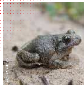
Dépourvu de queue, l'Alyte accoucheur Alytes obstetricans est un Anoure

En France, il existe deux grandes familles d'Amphibiens : celle des salamandres et des tritons (les Urodèles), possédant une longue queue, et avec des larves ressemblant à de petits adultes ; et celle des grenouilles et des crapauds (les Anoures), dépourvus de queue, sauf les têtards qui sont très différents des adultes.