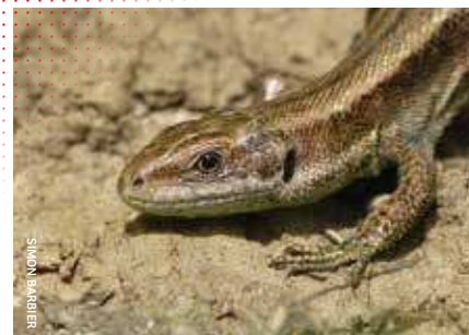
Détail des écailles de ce Lézard vivipare Lacerta vivipara profitant du soleil pour emmagasiner de la chaleur grâce à la thermorégulation

On les retrouve dans de nombreux habitats : déserts, marais, forêts, océans... Cette diversité de modes de vie explique la très grande variété de ce groupe. En France métropolitaine, on ne retrouve uniquement que deux grandes familles : celle des tortues (les Chéloniens) et celle des serpents et des lézards (les Squamates).