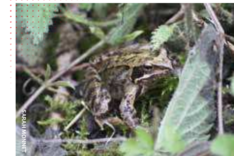
La Grenouille rousse Rana temporaria , comme de nombreuses espèces, est victime du trafic routier

Vous pouvez également signaler les animaux trouvés morts sur la route sur faune-et-route.org. Il nous permettra ainsi d'en apprendre davantage sur les secteurs à risque et nous permettra d'agir par la suite.