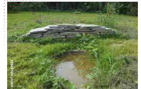
Mare et muret offrent gîte et couvert à de nombreuses espèces