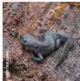
Le Triton crêté Triturus cristatus , un Urodèle