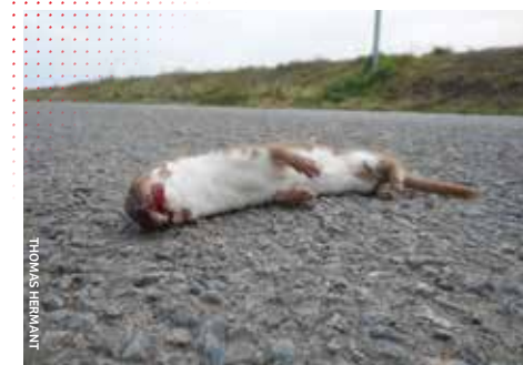
Une Belette d'Europe Mustela nivalis retrouvée morte écrasée sur le bord d'une route