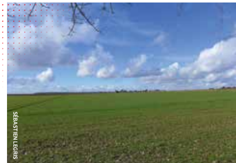
Paysage de grandes cultures défavorables au développement de la biodiversité