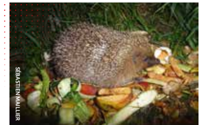
Le Hérisson, comme de nombreux animaux du jardin, se régaleront de vos épluchures