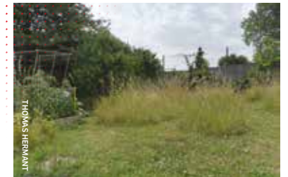
Jardin avec maintien de zones enherbées servant de refuge à de nombreuses espèces