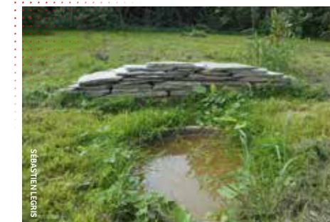
Petite mare et muret permettent d'accueillir la nature chez soi.

N'HÉSITÉZ PAS À CONTACTER PICARDIE NATURE POUR DE PLUS AMPLES INFORMATIONS ET QUELQUES CONSEILS SUPPLÉMENTAIRES ! NOUS SOMMES À VOTRE ÉCOUTE AU 03 62 72 22 50 OU VIA L'ADRESSE MAIL CONTACT@PICARDIE-NATURE.ORG.