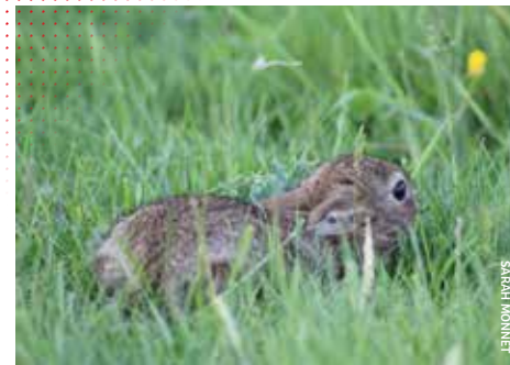
Le Lapin de garenne Oryctolagus cuniculus est aujourd'hui en forte régression en France

• Ils présentent une très grande variété : de taille (de quelques centimètres à plusieurs mètres), de poids (de quelques grammes à plusieurs tonnes), de régime alimentaire (carnivore, insectivore, herbivore, frugivore...), de taux de reproduction (un jeune par an à plusieurs dizaines) ou encore de lieu de vie (cours d'eau, forêts, bâtiments...).