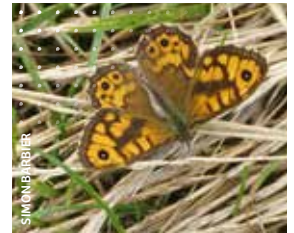
Exemple de la Mègère Lasiommata megera pour illustrer la cartographie régionale par espèce que permet Clicnat

Il est aussi possible de raisonner par espèce et de cibler ses prospections sur une ou plusieurs espèces méconnues, rares, menacées ou exotiques envahissantes. Il serait ainsi intéressant d'actualiser les données anciennes et de savoir si les différentes populations de l'espèce sont connectées ou non.