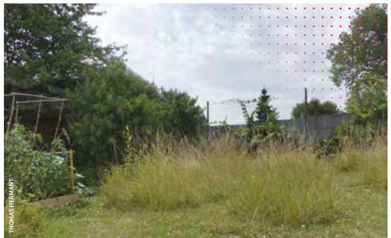
Jardin avec maintien de zones enherbées servant de refuge à de nombreuses espèces

Quelques actions sont faciles à mettre en oeuvre : le maintien de bandes enherbées, la pose de nichoirs, la favorisation de plantes locales (marguerite, origan, trèfle...), la non utilisation de produits phytosanitaires, et tous les petits gestes du quotidien qui favorisent la préservation de l'environnement.